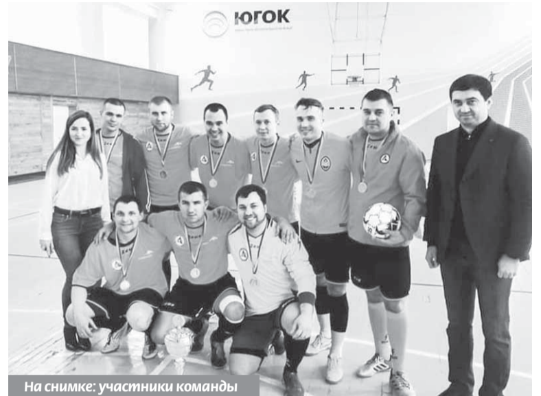
На снимке: участники команды