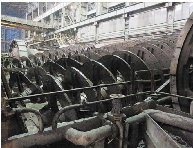
Читайте на стр. 2