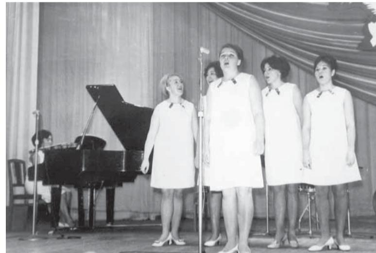
Выступление участниц хора отдела детских дошкольных учреждений.