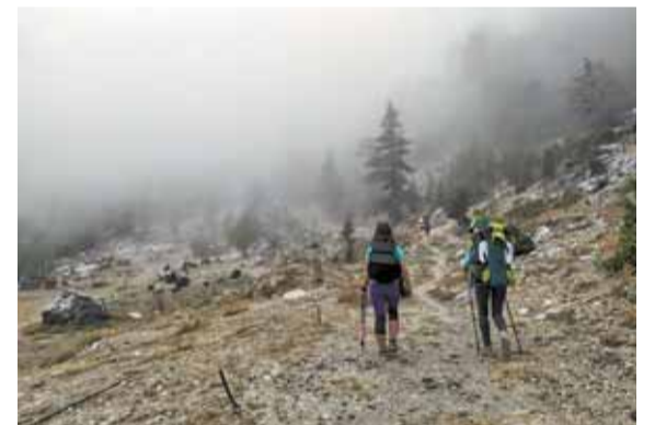
Алина ДОЦЕНКО