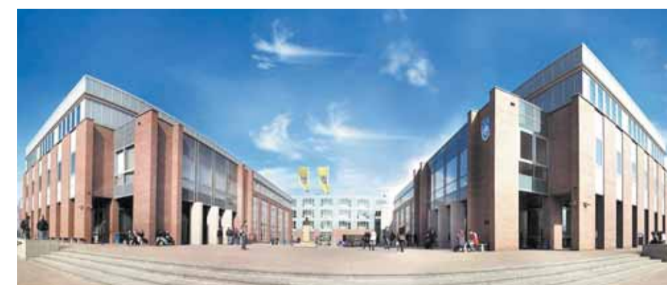
Обучение в Академии проводится по нескольким десяткам направлений, там получают образование более 17 тысяч студентов из более чем 30 стран мира