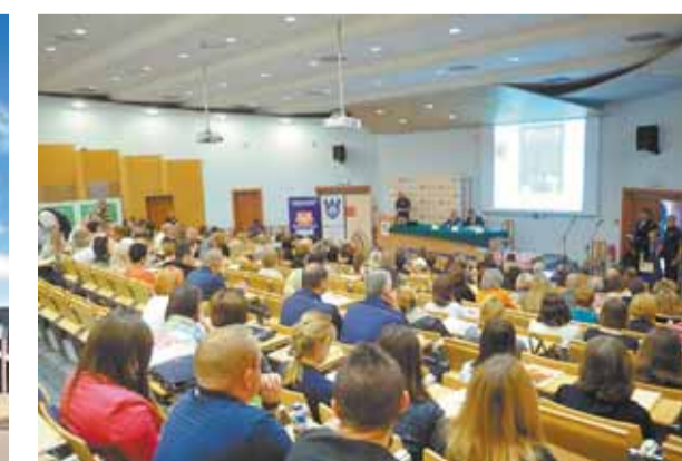
Учебные корпуса Академии оборудованы мультимедийными лекционными залами